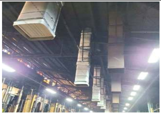
〈집중 근무장소에 냉방설비 설치〉