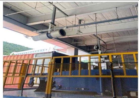
〈상하차 공간에 제트팬 설치〉